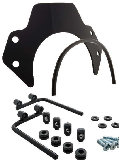
Windschild SIP MV656044 – 2B

Fahrzeugteilerart / Vehicle part type : Windschild für Krafträder / Windshield for motorcycles Typ / Type : SIP MV656044 Antragsteller / Applicant : SIP Scootershop GmbH