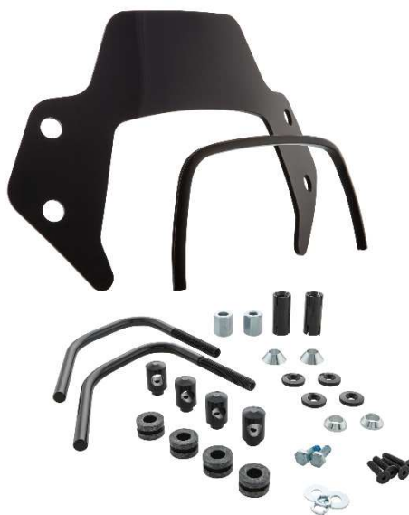
Windschild SIP MV656044 – 1B