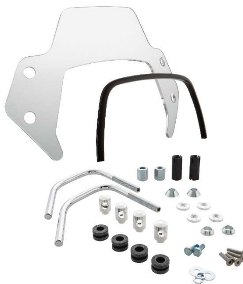
Windschild SIP MV656044 – 1C