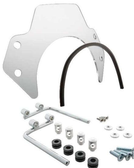
Windschild SIP MV656044 – 2C