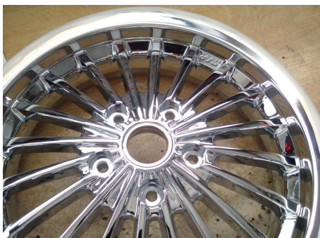
SIP 6506 Chrom / SIP 6506 Chrome