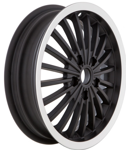
SIP 6506 Schwarz / SIP 6506 Black (mit poliertem Rand) / (with polished flange)